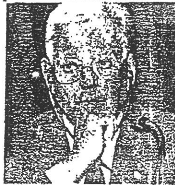
Umberto Agnelli, presidente Ibil

crescere la capacità competitiva delle proprie imprese e fare leva sulle aziende innovative per trainare la crescita complessiva del sistema produttivo». Il presidente della Confindustria, Antonio D'Amato, è d'accordo ma chiede allo stato di fare la sua parte. «Dobbiamo favorire gli investimenti esteri in Italia e i nostri investimenti sui mercati esteri, dando alle imprese più capacità di autofinanziamento. Per questo dobbiamo intervenire sul prelievo fiscale, sul mercato del lavoro, su vecchi nodi come quello delle pensioni, il welfare e la riforma della pubblica amministrazione».