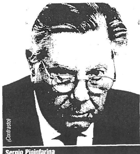
Sergio Pininfarina

Un nuovo Board e "tutor" settoriali per dare continuità alle relazioni